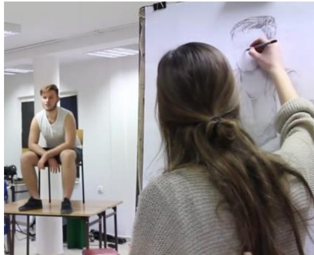
PRZYKŁAD SZKICE POSTACI